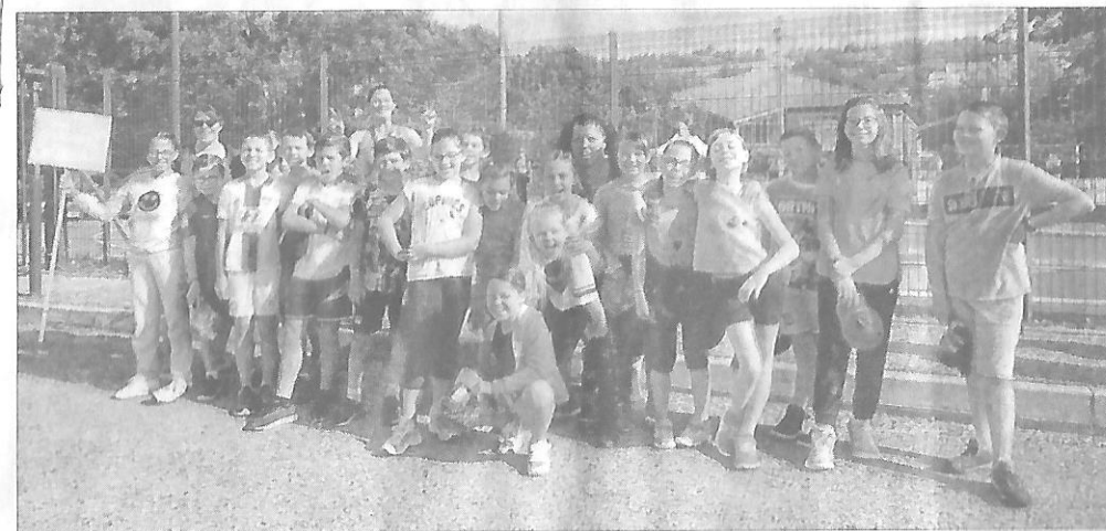
L'arrivée des délégations sur la piste d'athlétisme Claude-Jacuszin.