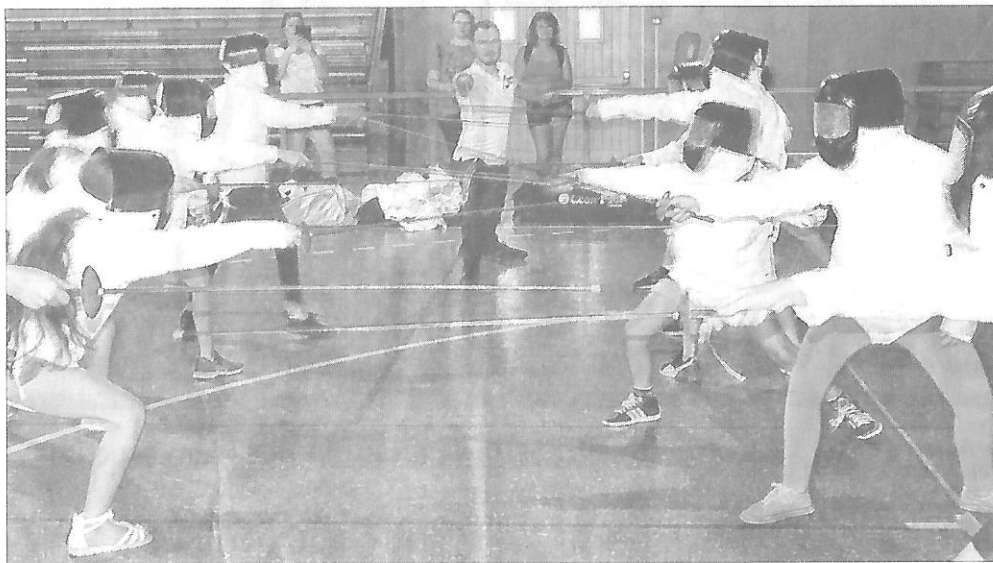
Une découverte de l'escrime proposée par le comité départemental.